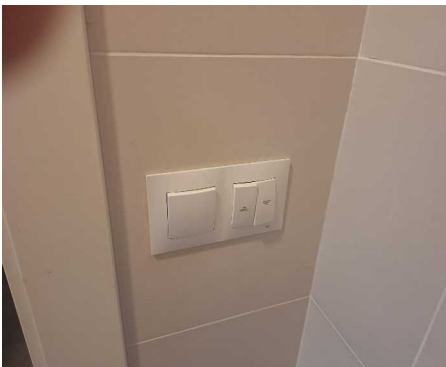
Fig.3 Interruptor ancho que voy a sustituir.