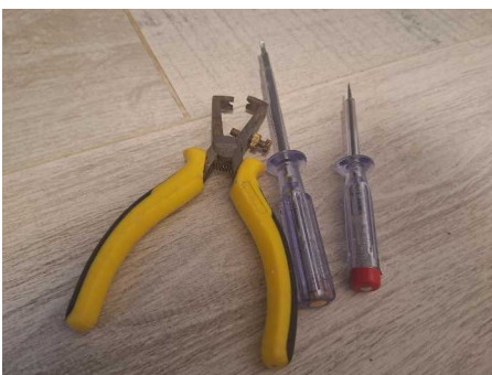
Fig. 5 Pelacables y atornilladores pequeños.