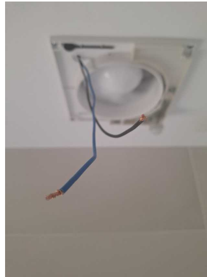
Fig. 8 Cuerpo extractor montado. A la espera de conexión.