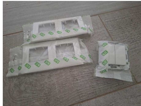
Fig. 2 Interruptores estrecho.