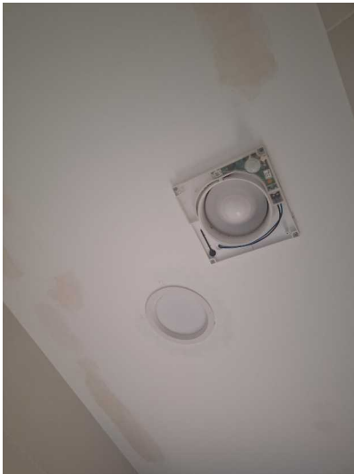
Fig. 9 Lud led y extractor conectados