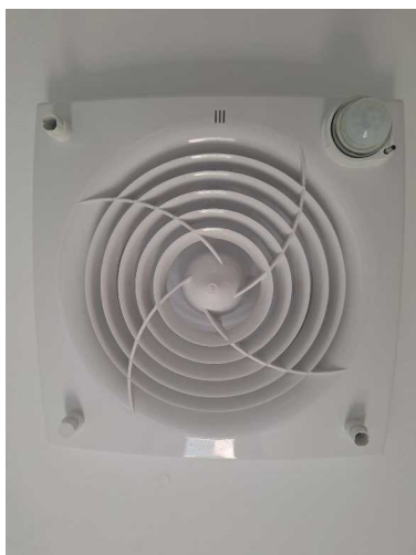
Fig. 11 Tapa protectora atomillada.