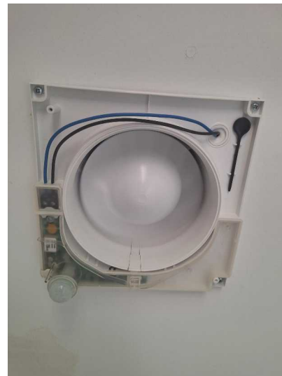
Fig. 10 Detalle cuerpo extractor y conexión.