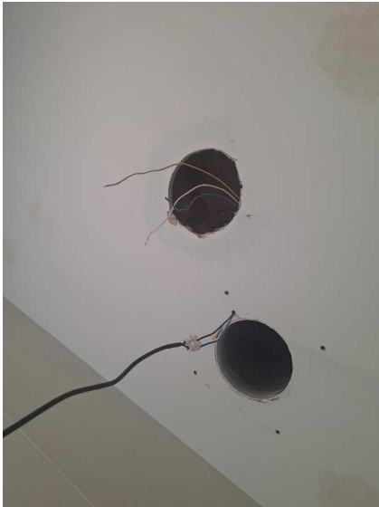
Fig. 7 Huecos existentes. Luz led y tubo "shunt" Cables pasados para alimentar extractor. Con portalámparas conectado para verificar que recibe corriente. Tacos fischer ya insertados en techo.