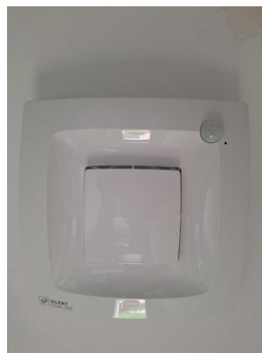
Fig. 12 embellecedor final-