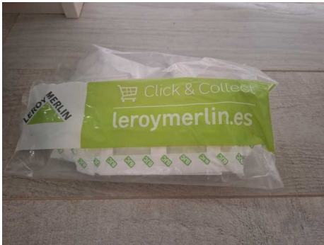
Fig.1 Pedido recogido en tienda.

Iniciamos el proyecto con la idea de sustituir una rejilla simple de plástico que nos pusieron en el cuarto de baño por un extractor eléctrico con el fin de evitar la alta acumulación de vapor de agua durante las duchas. Al mismo tiempo queremos duplicar un interruptor en el baño de manera que se pueda independizar la luz de la toma eléctrica del extractor. Aprovecho la intervención para pasar dos cables eléctricos de 1,5 mm fase y neutro para darle corriente al extractor para ello usaré el tubo del punto de luz y tendré que hacer un pequeño paso en el techo para acercar los cables al extractor. Me veo condicionado por la situación de la luz y la posición de entrada de los cables en el extractor. En la zona de interruptores quito un interruptor ancho y lo sustituyo por dos estrechos. Aunque el extractor elegido tiene control a través de un sensor pir de presencia y otro que funciona como un higrómetro en función de presencia de mayor o menor humedad, quiero poder apagarlo cuando no me interese que entre en funcionamiento por eso instalo un interruptor dedicado al extractor.