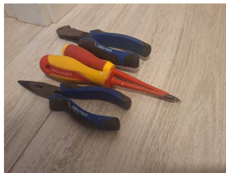
Fig. 4 Preparando alguna herramienta.